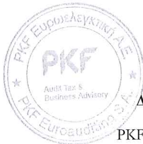
ΔΗΜΟΣ Ν. ΠΤΕΛΗΣ ΑΜ.ΣΟΕΛ 14481 PKF ΕΥΡΩΕΛΕΓΚΤΙΚΗ Α.Ε.